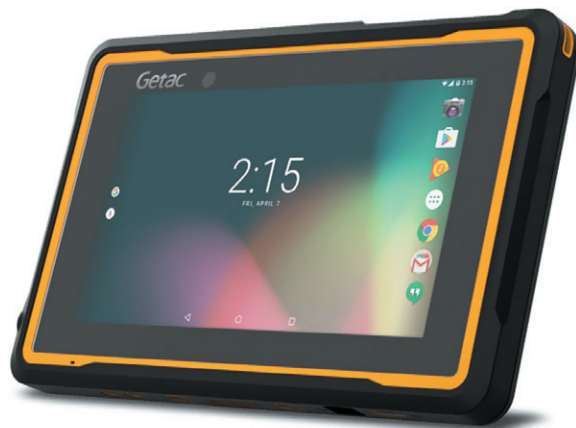
РИС. 1. ► Getac ZX70

Что касается вычислительной части, во всех модификациях планшета используется один процессор — Intel Atom X5-Z8350, работающий на частоте 1,44 ГГц. Это четырехъядерный ЦПУ, изготовленный по 14-нм технологии Cherry