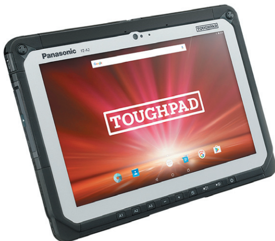
Рис. 2. ► Toughpad FZ-A2

Trail от Intel. В процессор встроена интегрированная графика восьмого поколения. Объем установленного накопителя равен 32 Гбайт, тип памяти — eMMC, также есть слот для карт памяти microSD. Оперативная память по умолчанию составляет 2 Гбайт и опционально может быть расширена до 4 Гбайт.